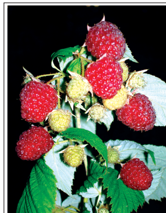
Малина, созревшая в августе, «Источник Жизни-6».

www.levashov.org www.levashov.info www.levashov.name