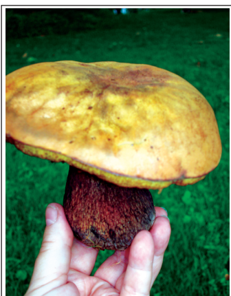
Белый гриб вырос в июне — «Источник Жизни-5».

« Источник Жизни » автор рассказывает и показывает результаты работы специального Генератора пси-поля, созданного им и размещённого в своём имении во Франции. Этот генератор, названный автором Источником Жизни и настроенный на воздействие только на определённую территорию, обеспечивает значительно более крепкое «здоровье», ускоренный рост и повышенную урожайность растений, посаженных в парке вокруг замка. Какие-либо химические удобрения, гербициды или пестициды не применяются вовсе, в этом нет никакой необходимости. Все растения очень крепкие и здоровые, благодаря воздействию Генератора, работающего