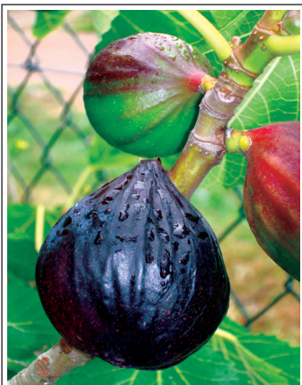
Плоды инжира в июле — «Источник Жизни-6»