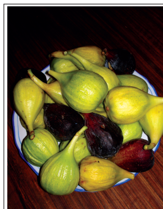
Зрелый инжир в августе — «Источник Жизни-6».

по специально созданной программе и обеспечивающего им всю необходимую защиту. Уникальные результаты, зафиксированные на многочисленных фотографиях, включённых в статьи, не оставляют никаких сомнений в их подлинности и в реальности того, что на них запечатлено. Полезность и важность этих результатов для человечества невозможно переоценить: они говорят о том, что урожайность можно увеличивать в разы , без истощения и убийства почвы. Внимательный читатель сразу поймёт все преимущества, предоставляемые