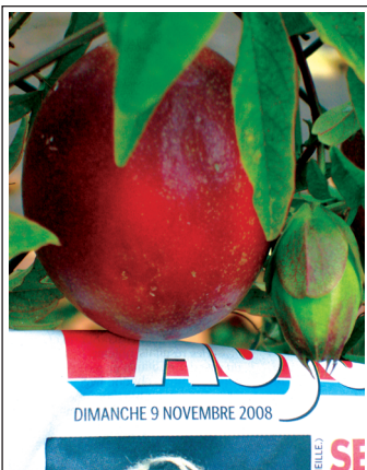
Зреющая пассифлора в ноябре, «Источник Жизни-6».

использованием подобных Генераторов: растения не нужно удобрять никакими ядами, которые почему-то называют химическими удобрениями, постоянно поливать, защищать от вредителей другими ядами, убивающими не только вредителей, но и сами растения. Генератор, следуя заложенной в него программе, воздействует на почву, благодаря чему, она постепенно преобразовывается оптимальным образом под нужды конкретного растения. Изменяя программу работы Генератора, автор воздействует на растения и изменяет их свойства